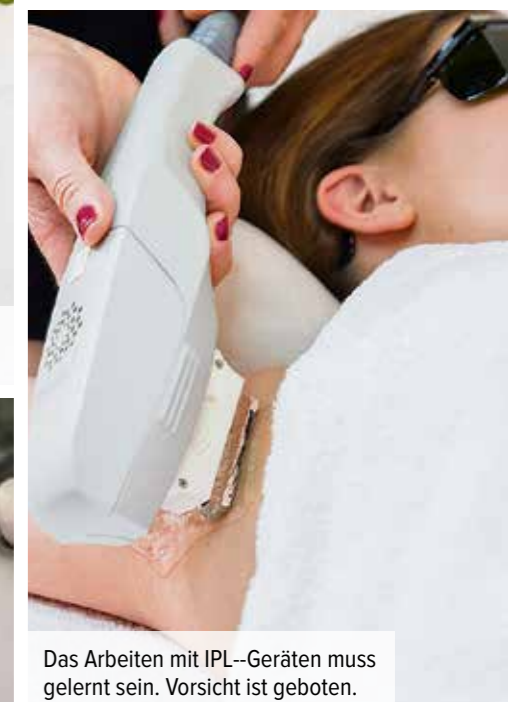
Das Arbeiten mit IPL-Geräten muss gelernt sein. Vorsicht ist geboten.